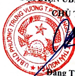
Đặng Thế Sơn