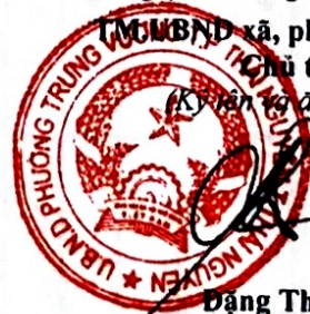
Đặng Thế Sơn