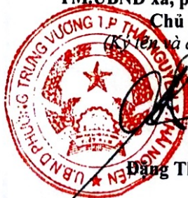
Đặng Thế Sơn