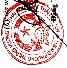
Đặng Thế Sơn