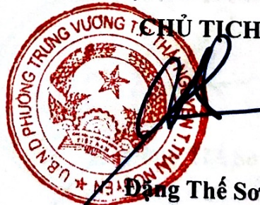
Đặng Thế Sơn